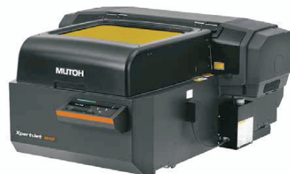
XpertJet 461UF / 661UF