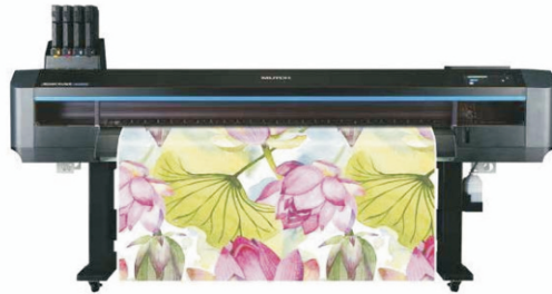
XpertJet 1641WR /