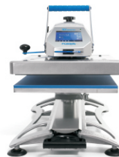
Hotronix Dual Fusion / Fusion Prensas